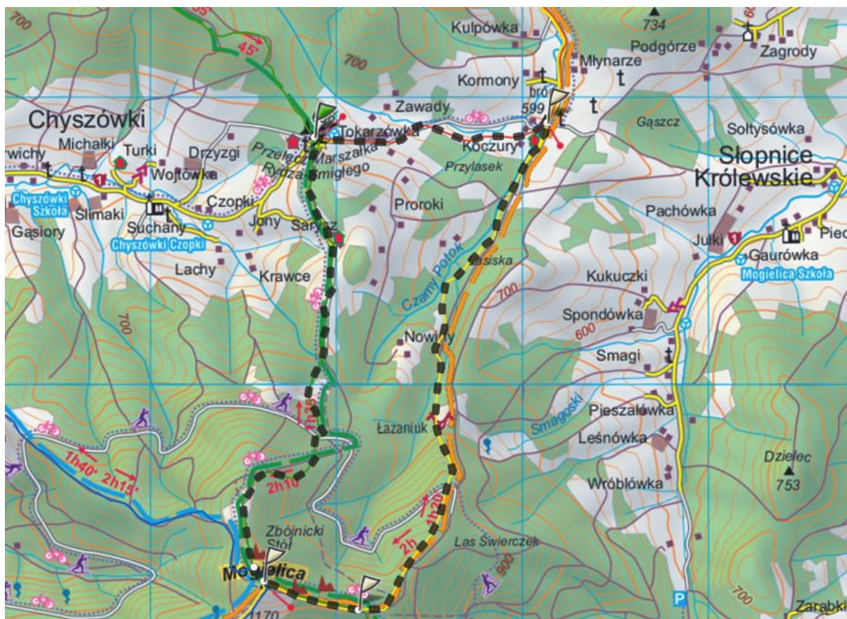
Przełęcz E. Rydza-Śmigłego – Przełęcz E. Rydza-Śmigłego 9.52 km · 3:20 h